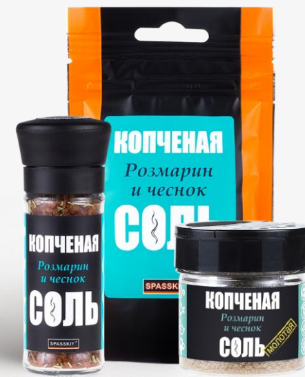
С РОЗМАРИНОМ И ЧЕСНОКОМ