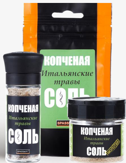
С ИТАЛЬЯНСКИМИ ТРАВАМИ