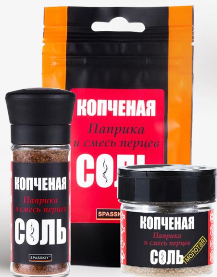
С ПАПРИКОЙ И СМЕСЬЮ ПЕРЦЕВ