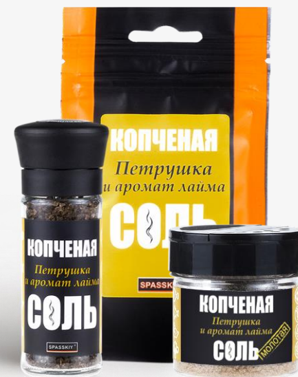
С ПЕТРУШКОЙ И АРОМАТОМ ЛАЙМА